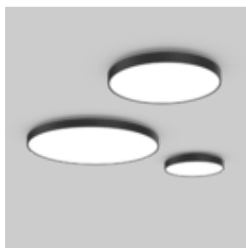
VELA surface / ceiling