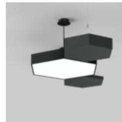
HEX-O suspended group