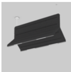
MUSE DOUBLE LIGHT acoustic suspended