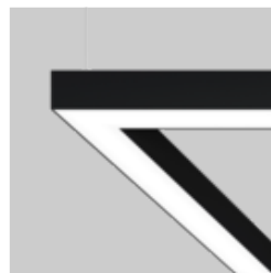
MINO 100 ceiling / suspended system