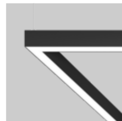
MINO 60 ceiling / suspended system