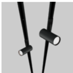
BO 55 / 70 track